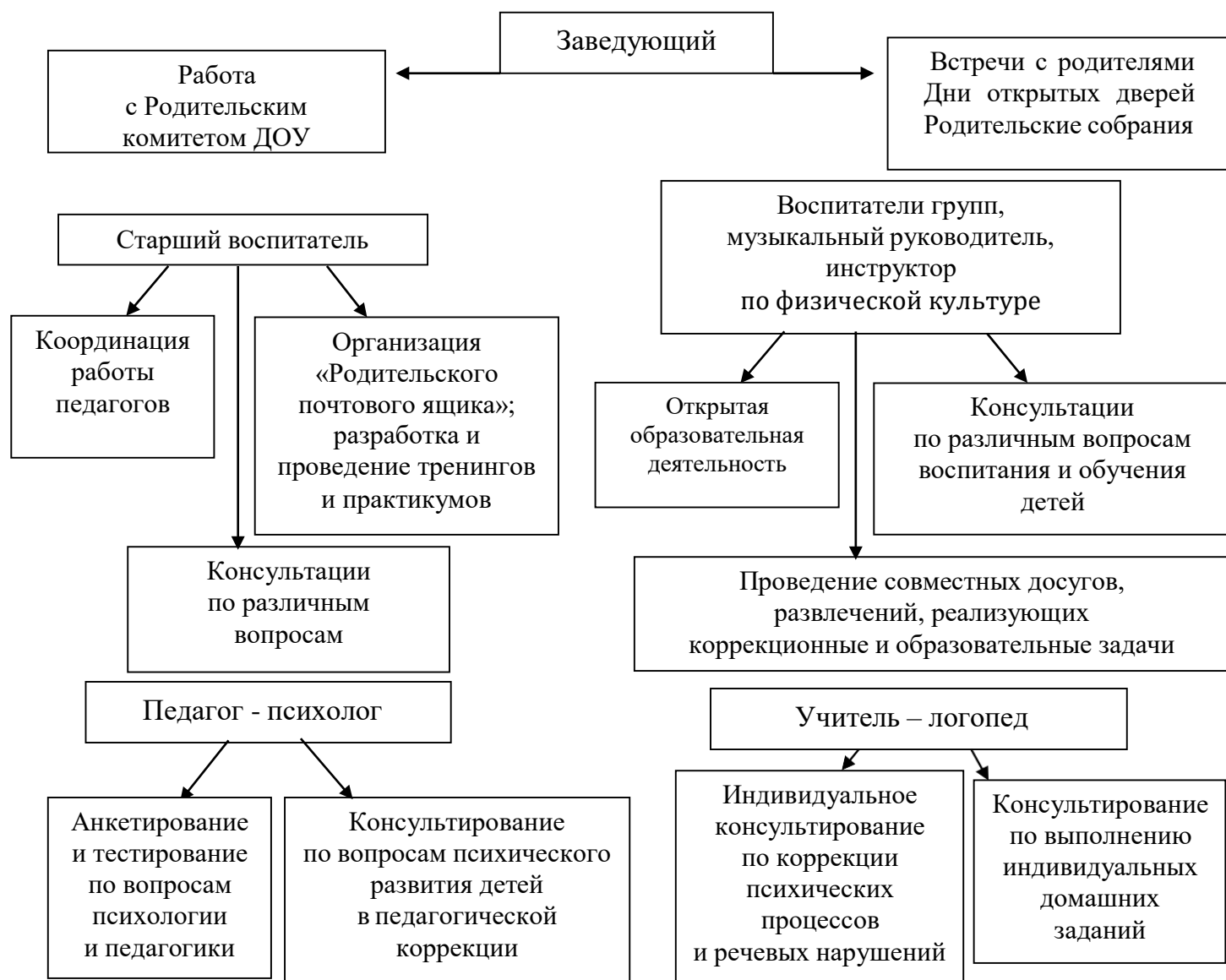
Рис. 1 «Схема взаимодействия с семьями воспитанников»