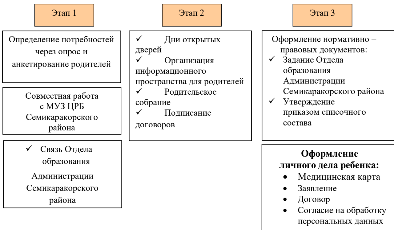
Рис. 3. «Этапы организации детей КМП»

С целью изучения степени удовлетворенности родителей качеством образовательных услуг консультационно – методического пункта, предоставляемых дошкольным образовательным учреждением, условиями пребывания их детей в детском саду, с целью выявления мнения родителей о получении образовательных услуг, а также возможные пожелания предусмотрено проведение социологического исследования удовлетворенности родителей качеством услуг консультационно – методического пункта, предоставляемых образовательным учреждением в периодичности 1 раз в квартал средствами анкетирования.