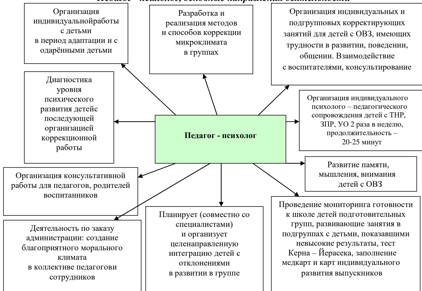
Рис. 2 «Педагог - психолог, основные направления деятельности»